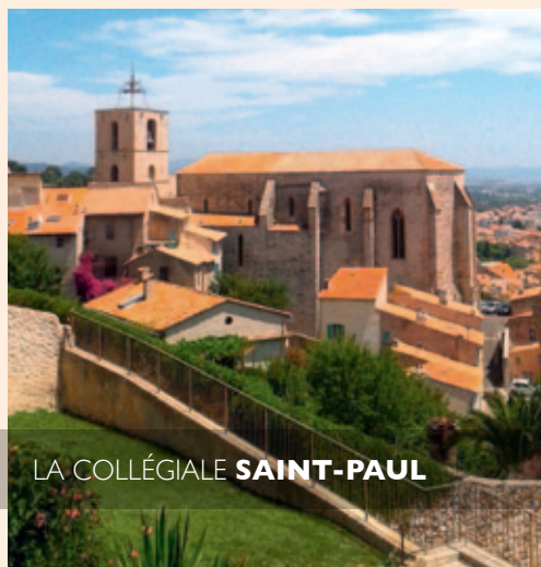
LA COLLÉGIALE SAINT-PAUL

Ensemble homogène du XIX ème tout au long de l'avenue, c'était "la promenade des Anglais" à Hyères. La Reine Victoria a aimé s'y promener entourée de sa cour royale.